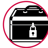
Une boîte se fermant à clé